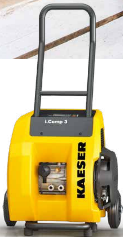
Afb.: i.Comp 3

Uitstekend geschikt om lange afstanden te overbruggen