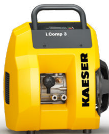
Afb.: i.Comp 3